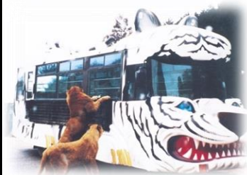
秋吉台サファリランド