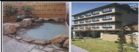
湯田温泉 梅乃屋 TEL 083-922-0051

<費用内訳> 三津浜港~柳井港往復フェリー代(車両 6m未満 1台・ドライバー込み + 同乗者1名含む)、 宿泊代(1泊2食付き)