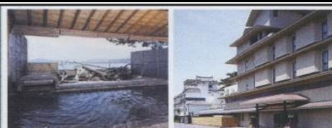
萩温泉 千春楽 TEL 0838-22-0326