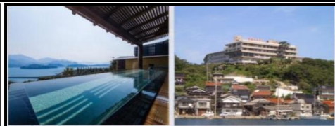
はぎ温泉 萩観光ホテル TEL 0838-25-0211