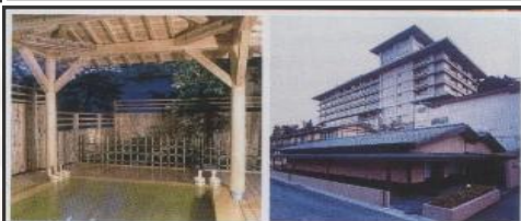
湯本温泉 山村別館 TEL 0837-25-3011